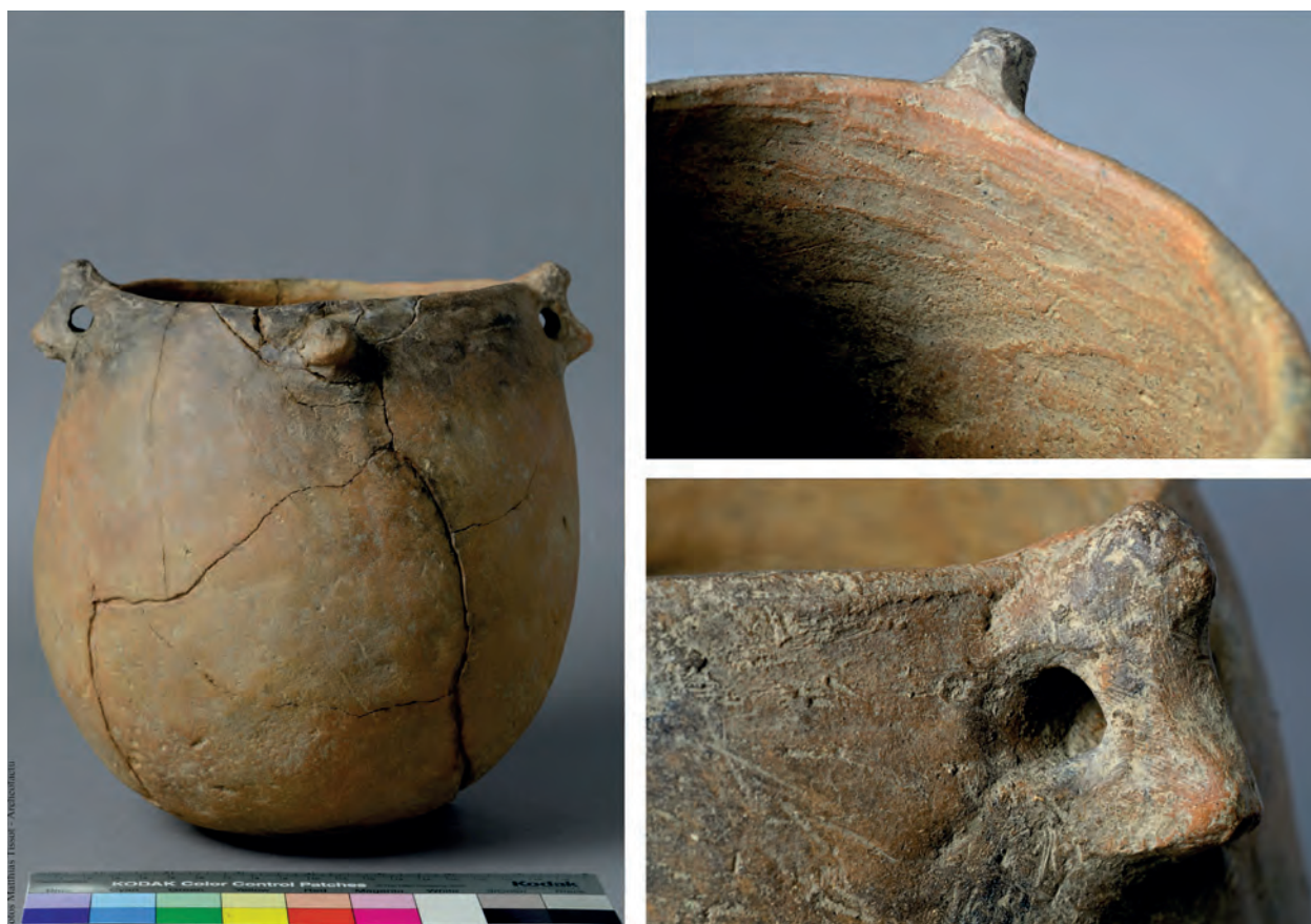
Fig. 3 Fotos do vaso neolítico (à esquerda) e de pormenores da parede interior e das pegas do mesmo (coluna de fotos da direita).

Como se pode observar na Fig. 3, trata-se de um recipiente em «saco», de bordo redondo, com 22,6 cm de altura, 20,2 cm de diâmetro máximo, 14,6 cm de diâmetro na abertura, apresentando as paredes uma espessura oscilando entre 0,8 e 1,3 cm. A pasta, compacta, apresenta abundantes elementos não plásticos, sobretudo minerais máficos, feldspatos e quartzos, de granulometria fina e média. A superfície externa é bem alisada, apresentando mesmo algum tipo de polimento, e a superfície interna, junto ao bordo, encontra-se espatulada, sendo mais rugosa a restante área interior. A cozedura é reductora com arrefecimento oxidante, o que lhe confere uma coloração entre as tonalidades alaranjadas e acastanhadas. Junto ao bordo existem duas asas «bífidas» e dois mamilos troncocónicos. O corpo do vaso não apresenta qualquer decoração.