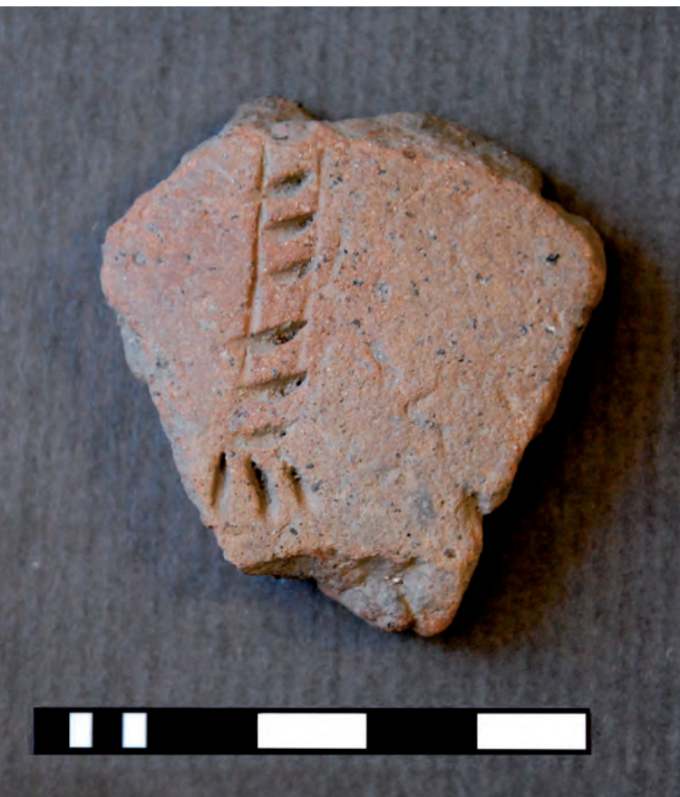
Fig. 2 Foto de fragmento de cerâmica neolítica com representação antropomórfica parcial.

encontra o seu melhor paralelo formal no conhecido fragmento do sítio neolítico antigo da Valada do Mato, Évora (Diniz, 2007). Em ambos os casos, trata-se da representação de um membro superior com figuração dos dedos, fazendo provavelmente parte de figuras de «orantes». Estas duas peças revestem-se de um evidente naturalismo que as afastam das representações mais esquemáticas identificadas por Diniz (2009) na reclassificação que esta autora faz dos achados anteriormente publicados de contextos de necrópole em gruta no Almonda (Torres Novas) e Eira Pedrinha (Condeixa). A triagem e exame deste conjunto, assim como a continuação dos trabalhos de escavação na necrópole, poderão permitir a recuperação de outros fragmentos do mesmo tipo.