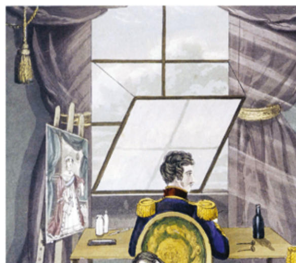
Fig. 3b - Pormenor da representação de D. Fernando enquanto gravador