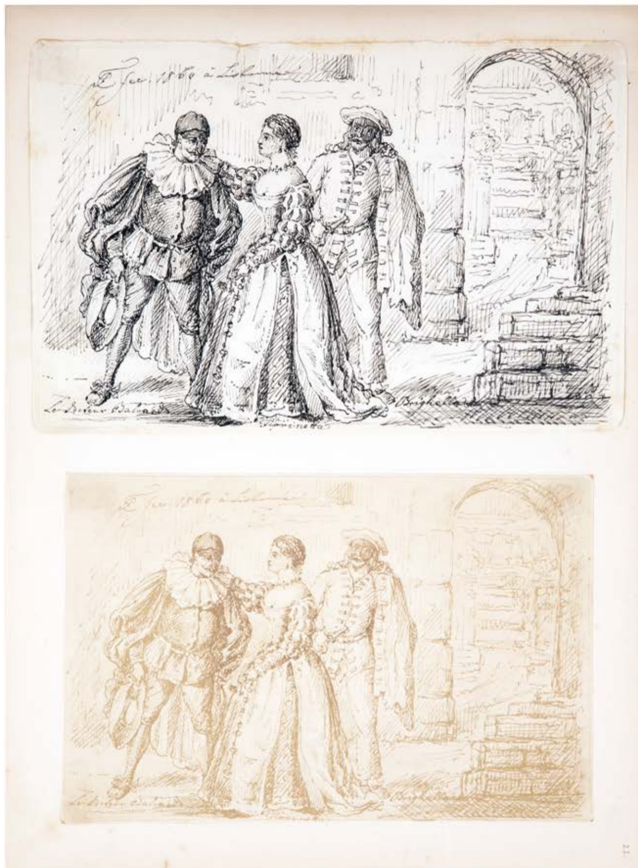
Fig. 9 - Personagens da Commedia dell'arte , ass. e dat.: FC fec. 1860 à Lisbonne , grafite e tinta sobre papel (superior); "reprodução fotográfica" (inferior), álbum (fl.22), col. Luís Mergulhão