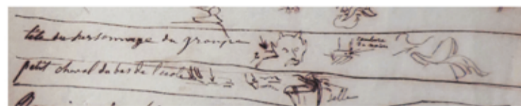
Fig. 4b - Observações nas matrizes (pormenor: tête de personnage de groupe), não datado nem assinado, PNP3475/3