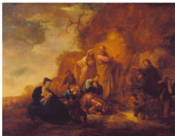
Fig. 2a - Jacob de Wet, Moisés no Rochedo de Horeb , pintura sobre madeira, 60 x 78 cm, séc. XVII, MNAA 1484 Pint.

Antes de chegar a Portugal, D. Fernando realizou um périplo por vários países europeus, sabendo-se que gravou durante a viagem um álbum 8 cujo paradeiro é hoje desconhecido. O mesmo tinha pertencido ao plenipotenciário belga Sylvain Van de Weyer, nomeado por Leopoldo I, tio do futuro rei, para o acompanhar a Portugal. É constituído, entre outros, por 43 desenhos e 11 águas-fortes, “na sua maioria da vida campestre portuguesa e de animais, assinadas e datadas de 1835-1837”. De acordo com a mesma descrição, uma das águas-fortes nele contida apresentava a inscrição a lápis “Estampada em Bruxelas 20 exemplares”, acrescentando-se que rainha Luísa dos belgas, tia de D. Fernando, “fez morder a chapa a bordo do Manchester a 2 de Abril de 1836” (Soares 1952, 67-68). Significa portanto que a arte da gravação foi um trabalho contínuo ainda antes de pisar território luso.