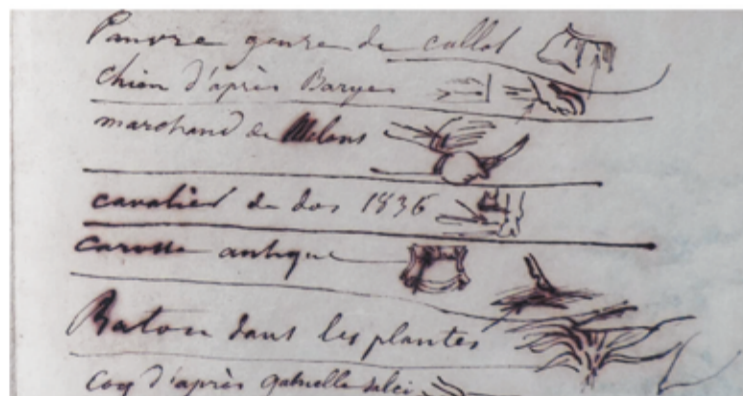
Fig. 4a - Observações nas matrizes 1º Julho 1851 (pormenor: marchand de melons), não assinado, PNP3475/1

Quanto ao irmão, Adolphe Eugène Brohy, teve um percurso mais modesto, com menos notoriedade, sem deixar de estar próximo de Edouard, como revela o facto de terem sempre trabalhado juntos para o rei em Portugal. Ficaria para a posteridade como uma figura de segundo plano, sabendo-se muito pouco a seu respeito.