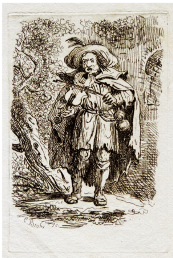
Fig. 8 - Mendigo a tocar violino, ass. E. Brohy , água-forte sobre papel, PNP3423

A atividade dos Brohy não se esgotou na colaboração mantida com D. Fernando II e com os três anos de ensino na Casa Pia, tendo Edouard feito carreira enquanto desenhador, gravador e litógrafo, técnica que apreciava particularmente (Vitorino 1944, 58), e de que já mencionámos um exemplo (Cat. 7). Assinalamos também o “Mendigo a tocar violino” 36 (Fig. 8), assinado E. Brohy , no que poderá corresponder a Edouard