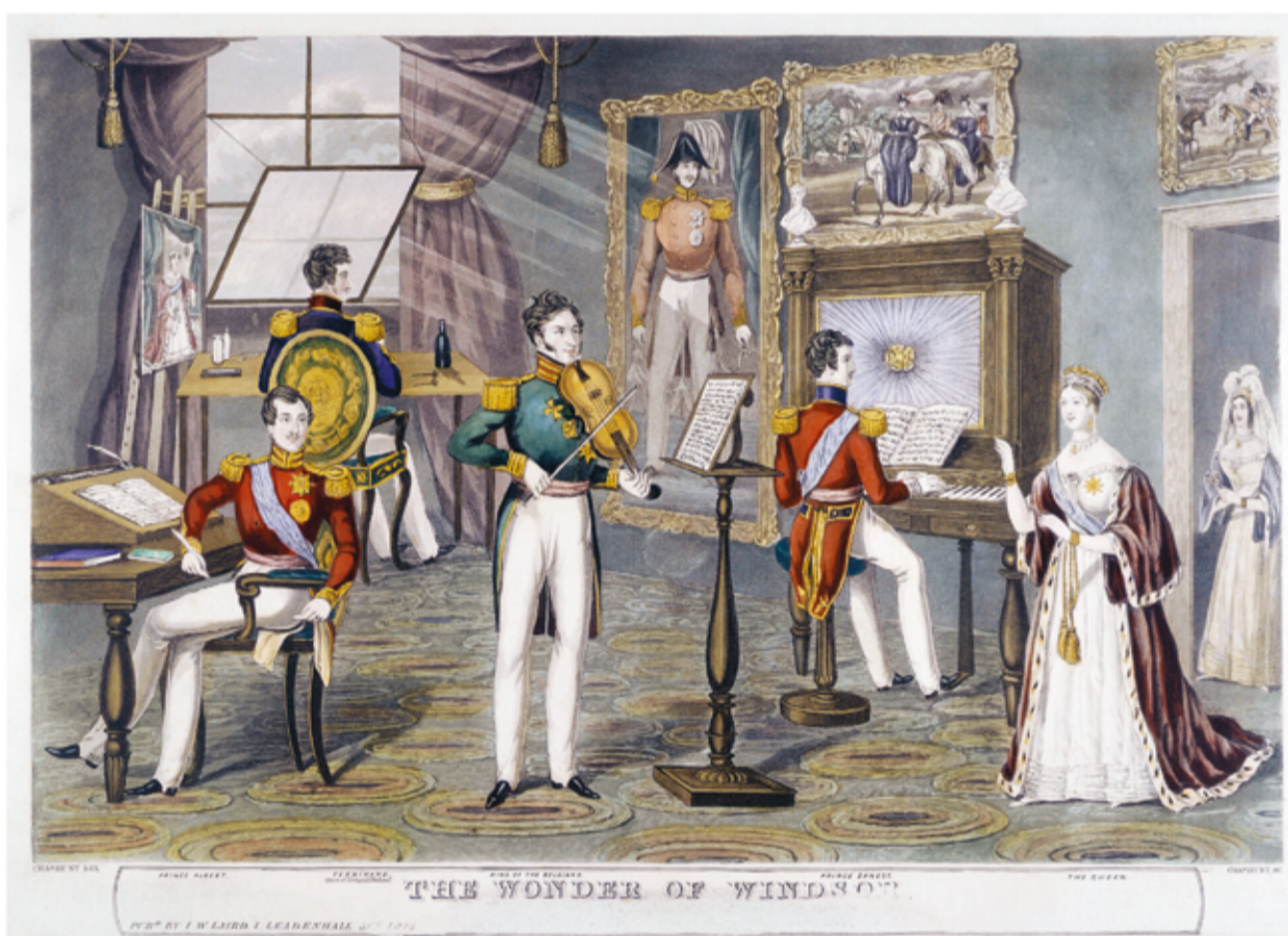
Fig. 3a - Charles Hunt, The Wonder of Windsor , gravura a água-tinta, 31 x 22 cm, Museum of London, n.º003531 (© Museum of London)

Imagem por excelência da dedicação de D. Fernando a esta atividade é uma gravura a água-tinta intitulada “The Wonder of Windsor” 17 , da autoria de Charles Hunt (1841), que representa um encontro imaginado entre os vários membros da família de Saxe-Coburgo e Gotha num dos salões do Castelo de Windsor. Trata-se essencialmente de um encontro alegórico/simbólico