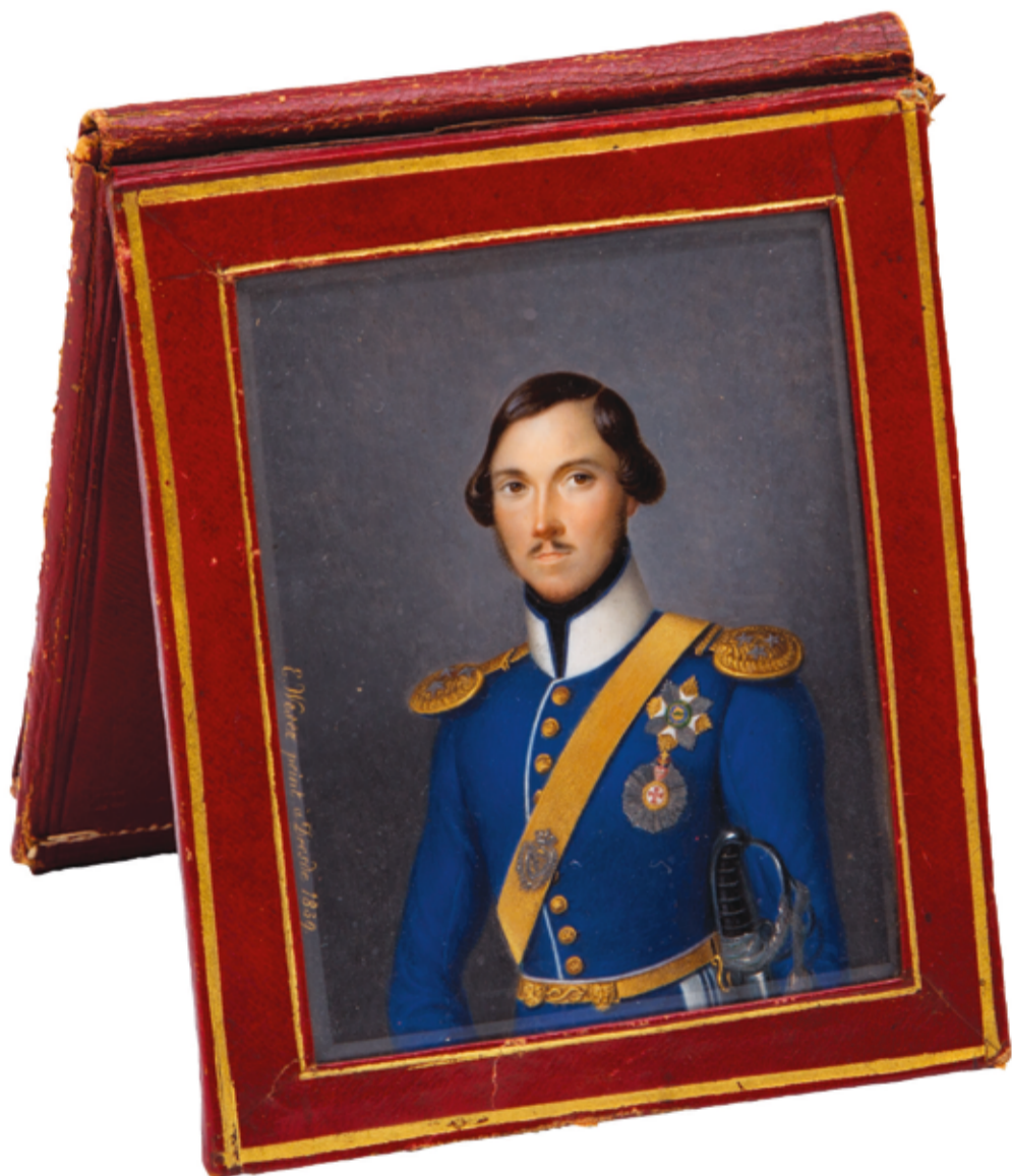
Fig. 1 - Ernst Christian Weser, Retrato de D. Fernando II, ass. e dat. E. Weser peint à Dresde 1839 , miniatura sobre marfim, 115 x 97 (mm), Col. J. C. C. P.