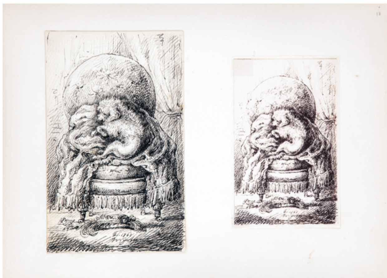
Fig. 10 - Cão deitado em poltrona, ass. e dat.: FC. f. 1862 , grafite e tinta sobre papel (esq.) e “reprodução fotográfica” (dir.), álbum (fl.18), col. Luís Mergulhão

artigo já mencionado, refere que quando recebeu os dois desenhos enviados pelo rei, vieram também as “réductions photographiques” (reduções fotográficas) dos mesmos (Busquet 1860, 153). Ora, ao olhar para um álbum de uma coleção particular, presente nesta exposição (Cat. 61), verificamos que, na maior parte dos casos, ao lado de cada desenho original, temos uma cópia de dimensões mais reduzidas, uma “redução fotográfica” (Fig. 9 e 10). Acreditamos que D. Fernando terá começado por entrecruzar estes dois métodos, acabando por deixar definitivamente o trabalho de gravador em 1864, para aparecerem somente estas múltiplas cópias, num processo aproximado à fotografia 38 , uma outra forma de reprodução. Um álbum conservado no Paço