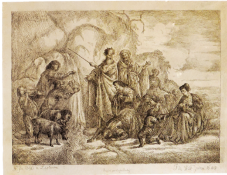
Fig. 2b - Moisés no rochedo de Horeb (segundo Jacob de Wit).

A Rainha dos Belgas cumpriu o prometido e enviou-lhe também um “manual de gravura” e uma coleção de águas-fortes de um súbdito seu, Eugène Verboeckhoven (1798-1881), autor que será também copiado por D. Fernando 9 . O “manual” poderá tratar-se de uma