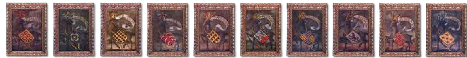
1 Almeidas 2 Carvalhos 3 Castros 4 Costas 5 Cunhas 6 Henriques 7 Ribeiros 8 Silvas 9 Sousas 10 Tavares

Le Livro do Armeiro-Mor [Livre du Grand Armurier] (1509) de João do Cró [Jean du Cros] et le Livro da Nobreza e Perfeição das Armas [Livre de la Noblesse et de la Perfection des Armes] (env. 1521-1541) d'António Godinho ont servi de modèle pour les blasons de cette salle. Le premier ouvrage est le plus important et le plus riche armorial portugais, commandé par Manuel I pour fixer les blasons existants à une époque où il n'y avait de règles établies pour l'utilisation des armoiries. Le second ouvrage revoit et complète le premier, devenant ainsi la référence héraldique nationale. Important recueil héraldique du premier quart du XVIe siècle, le plafond de la Salle des blasons constitue encore aujourd'hui une référence recherchée par les Portugais et les luso-descendants du monde entier.