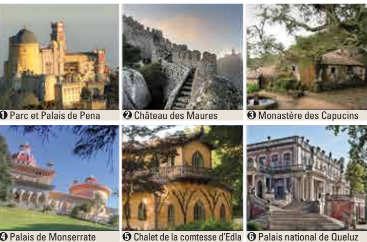
1 Parc et Palais de Pena 2 Château des Maures 3 Monastère des Capucins 4 Palais de Monserrate 5 Chalet de la comtesse d'Edla 6 Palais national de Queluz

De Lisbonne → Sintra: en train D'Estoril/Cascais → Sintra: en car